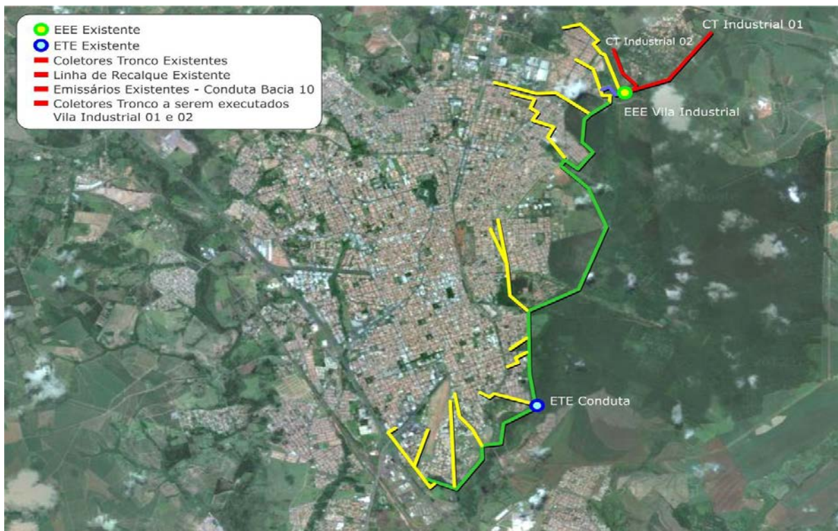
Figura 4.3.2. Vista das redes existentes (verdes e rosa) e projetadas (vermelho)