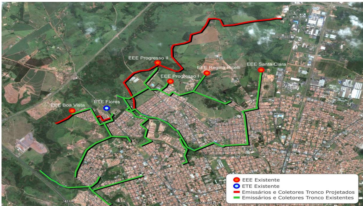
Figura 4.3.1. Redes existentes (em verde e amarelo) e projetadas (em vermelho)